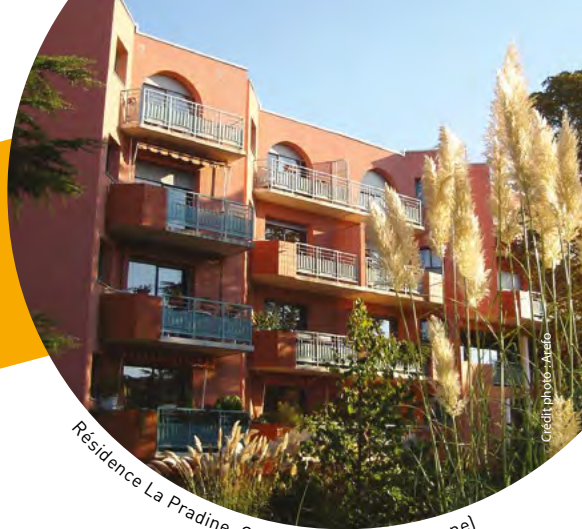
Résidence La Pradine, Colomiers (Haute-Garonne)

"Être chez soi tout en gardant un espace collectif"