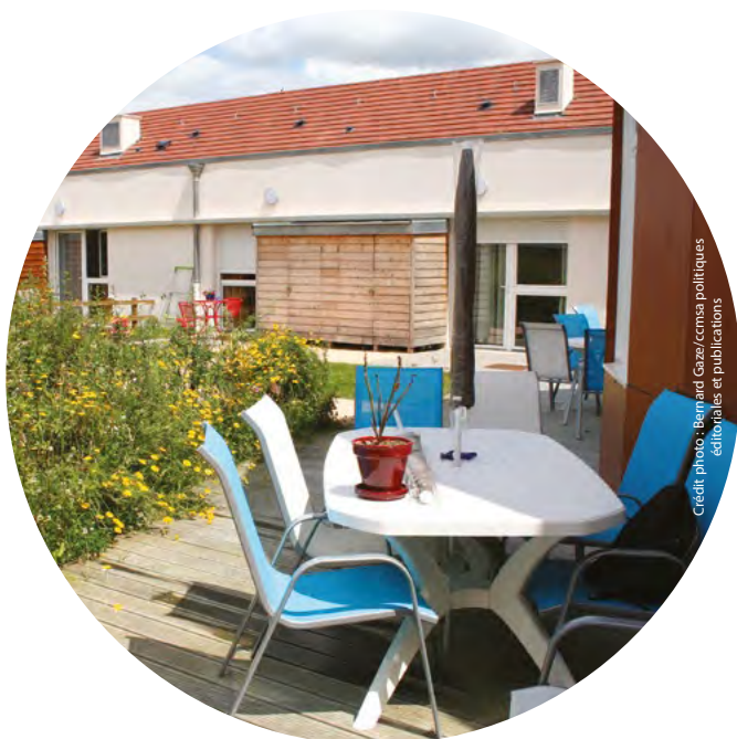
Crédit photo : Bernard Gaze / ccmsa politiques éditoriales et publications