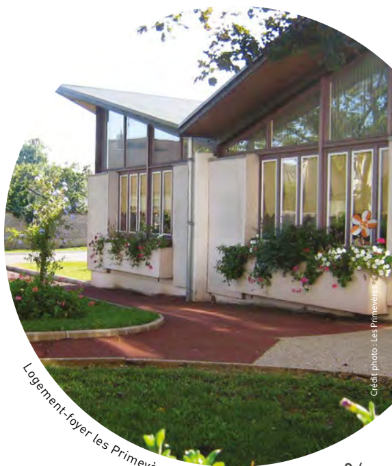
Logement-foyer les Primevères, Beaune (Côte-d'Or)