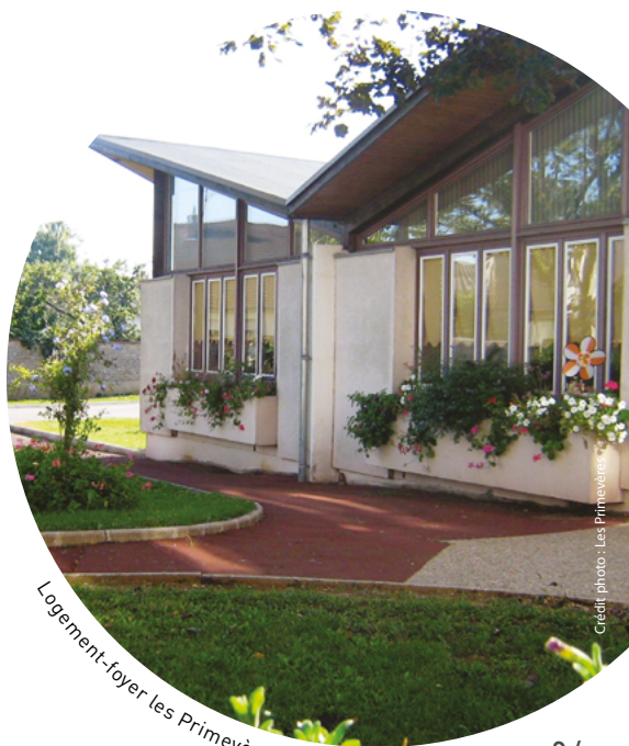
Logement-foyer les Primevères, Beaune (Côte-d'Or)

_ Les logements sont des T1 ou des T2 pour les couples avec une entrée indépendante, une petite cuisine et une terrasse. Des places de parking sont proposées. Les logements sont aménagés et meublés librement par les personnes retraitées. Elles peuvent y recevoir leurs proches et amener leur animal de compagnie.